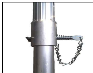
Sタイプ(後支柱スライド型)