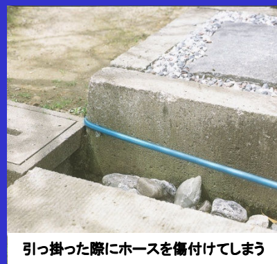
引っ掛った際にホースを傷付けてしまう