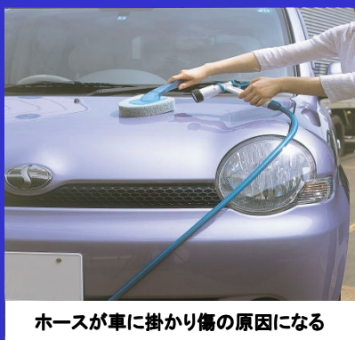
ホースが車に掛かり傷の原因になる