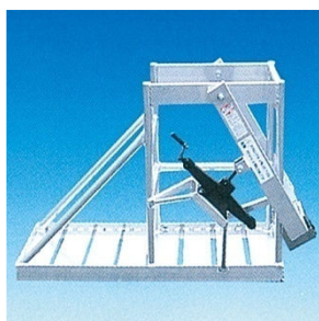
張出し型<ジャッキ式>