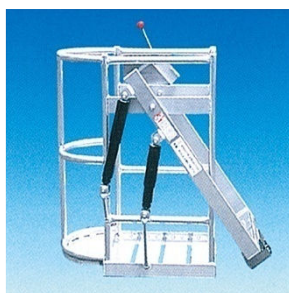
先丸型<アブソーバー式>