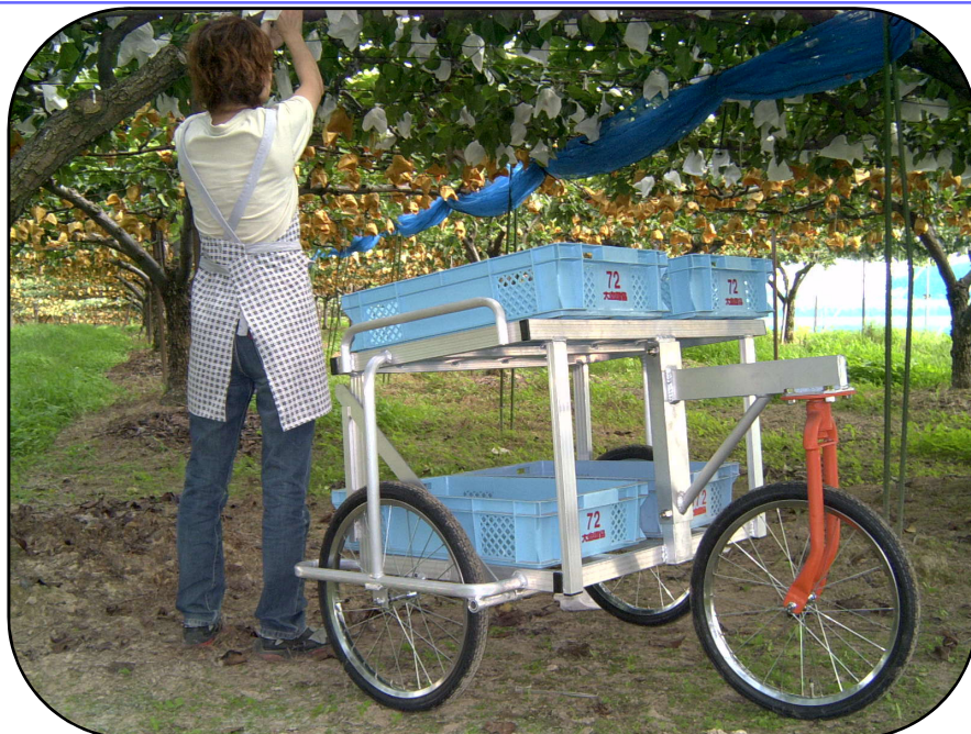
サイドブレーキ付