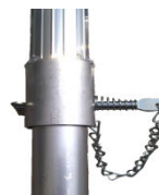
Sタイプ (後支柱スライド型)