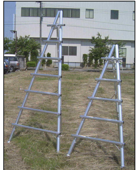
ステップ出張り型