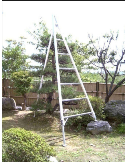
3本の脚が全て伸縮するタイプ